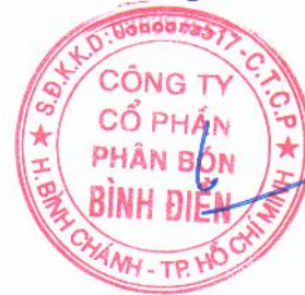
LÊ QUỐC PHONG