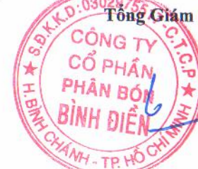
LÊ QUỐC PHONG

Thuyết minh này là một bộ phận không thể tách rời với Báo cáo tài chính